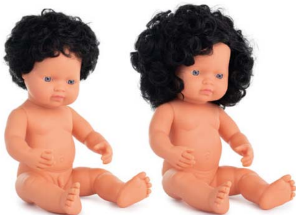
Referência 2213.05.31231 DESIGNAÇÃO BONECO EUROPEU 38CM C/CABELO PRETO ENCARACOLADO Um boneco