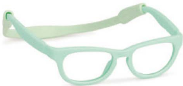
Referência 2213.05.31210 DESIGNAÇÃO ÓCULOS DE BONECA EM AZUL TURQUESA