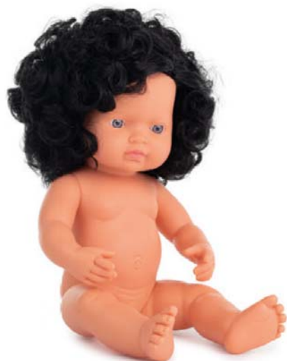
Referência 2213.05.31232 DESIGNAÇÃO BONECA EUROPEIA 38CM C/CABELO PRETO ENCARACOLADO